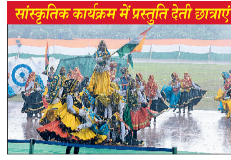
सांस्कृतिक कार्यक्रम में प्रस्तुति देती छात्राएं

राजीव गांधी खेल परिसर में आयोजित राज्य स्तरीय स्वतंत्रता दिवस समारोह को संबोधित कर रहे थे। सीएम ने सांस्कृतिक कार्यक्रमों में हिस्सा लेने वाले प्रतिभागियों के लिए एक लाख रुपये की धनराशि देने की घोषणा की तथा जिला के सभी निजी व राजकीय विद्यालयों में 18 अगस्त सोमवार को अवकाश