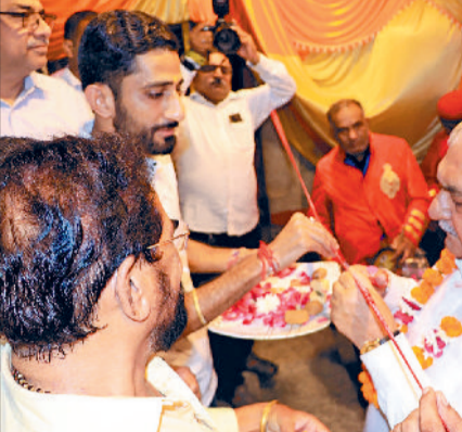
रोहतक। दुर्गा भवन मंदिर में जन्माष्टमी के पर्व का शुभारंभ करते पूर्व मुख्यमंत्री भूपेंद्र सिंह हुड्डा।