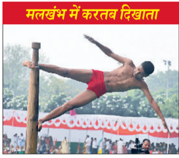
मलखंभ में करतब दिखाता

अपने तीसरे कार्यकाल में बिना खर्च-पर्चों के 30 हजार युवाओं को सरकारी नौकरियां दी हैं। इन्हें मिलाकर पिछले साढ़े 10 साल में 1 लाख 80 हजार नौकरियां दी जा चुकी हैं। हाल ही में कॉमन पात्रता परीक्षा का सफलतापूर्वक आयोजन किया गया है। इसके अलावा, सरकार इस विभाग के माध्यम से 5 हजार से अधिक युवाओं को विदेशों में रोजगार दिखाने जा रही है। सीएम ने कहा कि किसी भी व्यक्ति से, कमी भी, कोई भी शिकायत प्राप्त होती है, तो उस पर पुलिस को तुरंत कार्रवाई करने के सख्त निर्देश हैं।