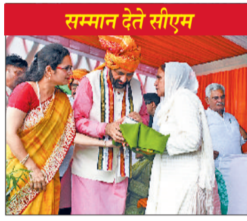
सम्मान देते सीएम