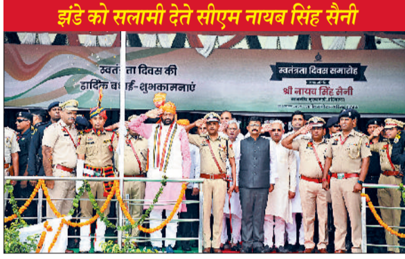
इंडे को सलामी देते सीएम नायब सिंह सैनी

मुख्यमंत्री नायब सिंह सैनी ने 79वें स्वतंत्रता दिवस के अवसर पर कहा कि भारत आज चौथी सबसे बड़ी आर्थिक शक्ति है और पीएम मोदी के नेतृत्व में इसे विश्व की सबसे बड़ी आर्थिक शक्ति बनाना है। इसके लिए आत्मनिर्भर भारत को जन-आंदोलन बनाना होगा। सीएम नायब सिंह सैनी ने कहा कि हरियाणा सरकार ने पिछले साढ़े 10 वर्षों में प्रदेश की जनता को भेदभाव करने वाली व्यवस्था से आजादी दिलाई है। हर सरकारी योजना एवं कार्यक्रम को 100 से अधिक पोर्टल व ऐप के माध्यम से पारदर्शी बनाया है। सीएम ने स्वदेशी को अपनाने, 'वोकल फॉर लोकल' और 'लोकल फॉर ग्लोबल' के मंत्र पर बल दिया। सीएम ने उद्योगपतियों, निवेशकों, तकनीशियनों, वैज्ञानिकों से अपील की कि वे देश को आत्मनिर्भर बनाने के लिए अपने-अपने कौशल का उपयोग करें। सीएम शुक्रवार को