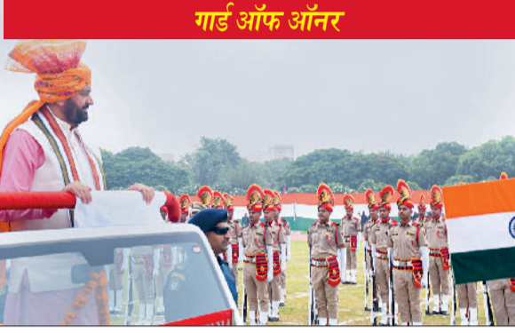
गार्ड ऑफ ऑनर

घोषित किया। मद्रि परिसर स्थित राज्य स्तरीय शहीदी स्मारक पर वीर शहीदों को पुष्प चक्र अर्पित कर उन्हें नमन किया। समारोह में मुख्यमंत्री ने परेड की टुकड़ियों का निरीक्षण किया और सलामी ली। युद्ध वीरगनाओं, व स्वतंत्रता सेनानियों के परिजनों और आश्रितों को सम्मानित किया।