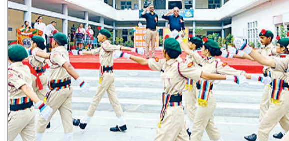
महम। आरकेपी स्कूल मदीना में एनसीसी परेड की सलामी देते मुख्य अतिथि।

रोहतक। राजीव गांधी खेल परिषद में मनाए गए मुख्य समारोह में प्रदेश के मुख्यमंत्री नायब सिंह सैनी द्वारा इन संस्थाओं को सम्मानित करवाया गया। जिस में रोहतक की अग्रणी सामाजिक संस्था बाबा बंदा बहादुर सेवा समिति को भी समिति द्वारा अर्जित उत्कृष्ट समाजिक सेवाओं के लिए सम्मानित किया गया। बाबा बंदा बहादुर सेवा समिति रोहतक जिला प्रशासन रोहतक व मुख्यमंत्री नायब सिंह सैनी का तहदिल से धन्यवाद करती है कि आप ने समाज सेवा करने वाली समाजिक संस्था बाबा बंदा बहादुर सेवा समिति रोहतक को उत्कृष्ट समाजिक सेवाओं के लिए प्रशस्ति पत्र देकर सेवा समिति में निष्काम सेवा कर रहे सेवादाता का मान और उत्साह बढ़ाया है।