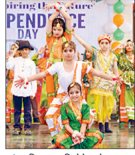
सांस्कृतिक प्रस्तुति देते बच्चे।

कि इंडस पब्लिक स्कूल के छात्र केवल पढ़ाई व खेलों में ही नहीं बल्कि आज हर क्षेत्र में उच्च पदों पर कार्यरत हैं। उन्होंने विद्यालय के अन्य छात्रों को भी महापुरुषों व सैनिकों सम्मान करने की सीख दी। निदेशिका ने अपने संदेश में सभी को स्वतंत्रता दिवस की शुभकामनाएं देकर व बच्चों को आजादी का अर्थ बताया। उन्होंने कहा कि स्वतंत्रता संघर्ष का अंत नहीं बल्कि एक नए कर्तव्य की