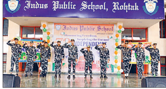
रोहतक। देशभक्ति से ओतप्रोत सांस्कृतिक प्रस्तुति देते विद्यार्थी।

अवसर पर चारों सदनों के विद्यार्थियों ने राष्ट्रीय ध्वज को सलामी देते हुए मार्च पास्ट किया। भाषण, समूह गान, कविता कि अद्भुत प्रस्तुति द्वारा खूब तालियां बटोरीं। छात्रों ने लघु नाटिका